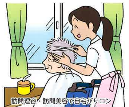
訪問理容・訪問美容で自宅がサロン

生活衛生業は、訪問理容・訪問美容等の要介護者等に対する在宅生活支援サービスの提供、健康食メニューや健康入浴等の実施による外出支援サービスの提供など、地域の住みやすさ、街づくりにも貢献しています。